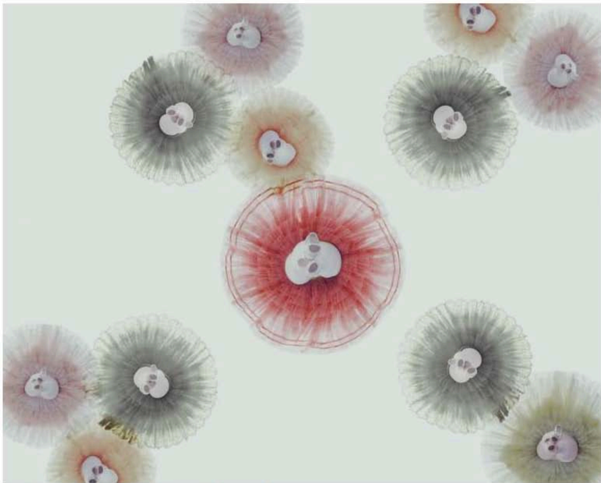
© BAKi, Vision (Under) 2, 2016, courtesy OPIOM Gallery

Ex danseur soliste du Ballet national de Corée, c'est en connaisseur que BAKi, aka Park Kwisub, explore le corps. L'exposition Illusion s'articule autour de trois séries intitulées " Ink ", " Vision " et " Shadow ". Orchestrant son propre univers pictural, le photographe joue avec le corps et l'espace. À travers son imaginaire, BAKi prolonge le geste du danseur. Mouvement, décor et photographie fusionnent laissant place à un ballet de figures géométriques.